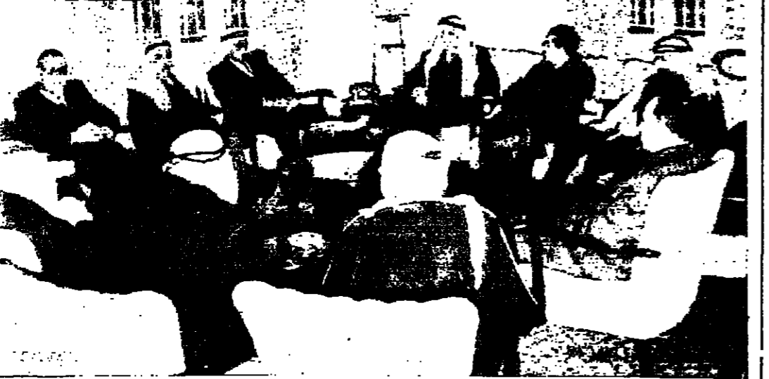
السيد بهجت التلهوني رئيس الوزراء يستعرض الشؤون الراحنة مع لجنة الشؤون الخارجية اجلس التسواب

سايجون - رويتر - كتعت قوات فيكونغ والقوات الفيتنامية الشمالية تبدو مسيطرة امس على اجزاء واسعة من عدة مدن رئيسية في فيتنام الجنوبية - وفي سايجون وضعت القوات الحليفة حواجز من الاسلاك الشائكة عبر شوارع نو دو الرئيسي وتقوم الدبابات والسيارات المصفحة بأعمال الدورية في قلب العاصمة. ودعت جبهة التحرير الوطني وهي الجناح السياسي لفيتكونغ للتحسب الفيتنامي الى الثورة على الجيش والحكومة القبلية الجنوبية. وحسب بيان اتبع من راديو التحرير ان قوات فيكونغ ايضا شملت وجنود القوات المسلحة لفيتنام الجنوبية على تحويل سلاحهم ضد الجيشين. القية على الصفحة الخامسة عمود ٧